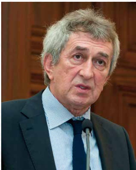
Kulcsár Szabó Ernő

1950-ben született, az MTA rendes tagja, az ELTE Magyar Irodalom- és Kultúratudományi Intézetének professor emeritusa. Kutatási területei: irodalmi hermeneutika, irodalomelmélet, kultúratudomány, 20. századi magyar irodalom. Legutóbbi szerkesztett kötete: Geschichte der ungarischen Literatur. Eine historisch-poetologische Darstellung , Walter de Gruyter, Berlin/Boston, 2013. Legutóbbi tanulmánykötete: Költészet és korszakküszöb. Klasszikusok a modernség fordulópontján , Akadémiai, Budapest, 2018.