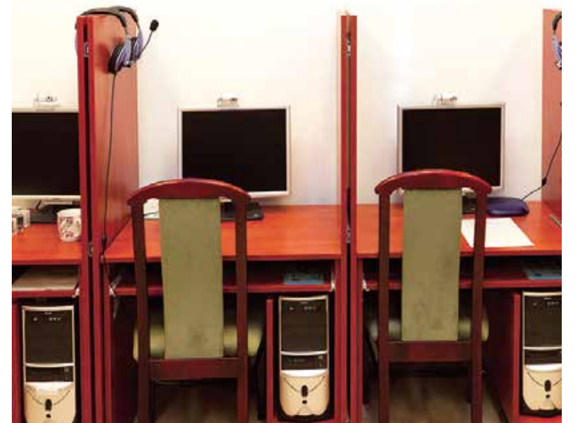
Jelek és jelzések