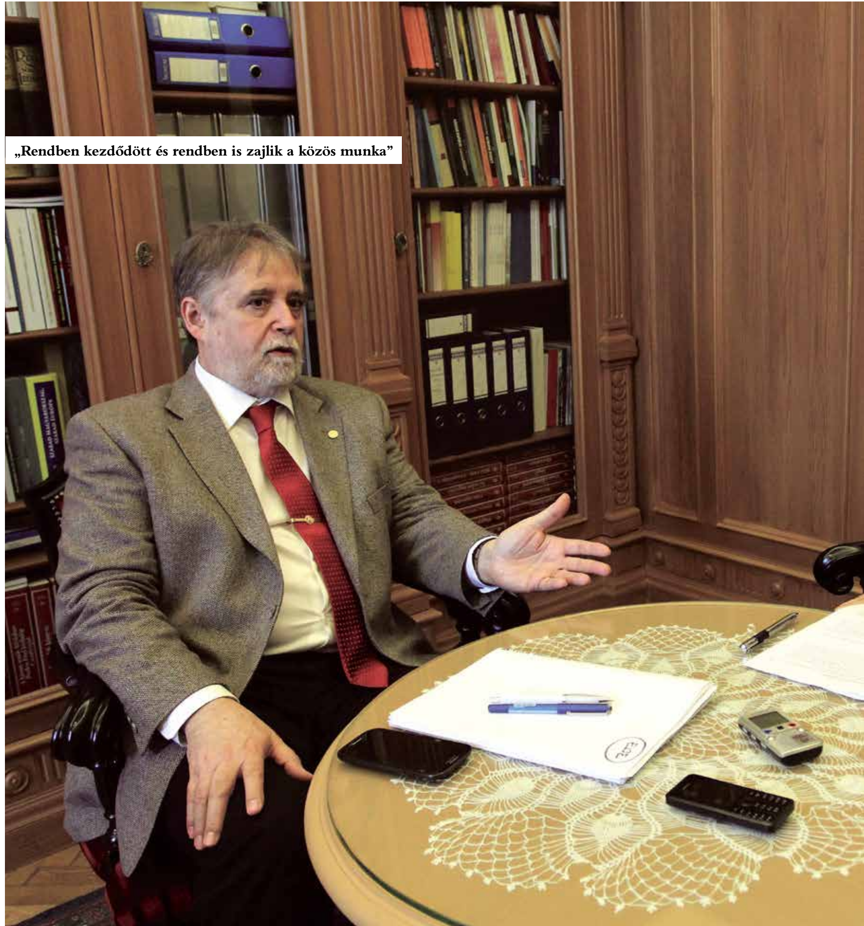
DR. MEZEY BARNA REKTOR ÉS DR. SCHEUER GYULA KANCELLÁR AZ ELTE TÖBBMILLIÁRDOS FEJLESZTÉSEIRŐL ÉS A LEGFONTOSABB OKTATÁSI

Sch. Gy.: Tavaly képzési támogatásként – a csökkenő hallgatói létszám ellenére – félmilliárd forinttal kaptunk többet, mint 2014-ben. A képzési támogatások területén idén nem számolunk jelentős növekedéssel. A Felsőoktatási Struktúraátalakítási Alapból (FSA) 2015-ben mintegy 700 millió forintnyi támogatáshoz jutottunk, amelyből egyebek mellett az egyetem nemzetközi fogadóképességének javítására fordítottunk összegeket, de egy jelentősebb informatikai fejlesztés is elstartolt. Ezekre felül KEOP-beruházásokhoz 650 millió forintot nyertünk el, tavaly decemberben pedig a Bibó Kollégiumhoz 700 millió forintos támogatásról, illetve egy ötmilliárd forintnyi KEOP-pályázatról született kedvező kormányzati döntés. Az év elején életbe léptetett béremelések