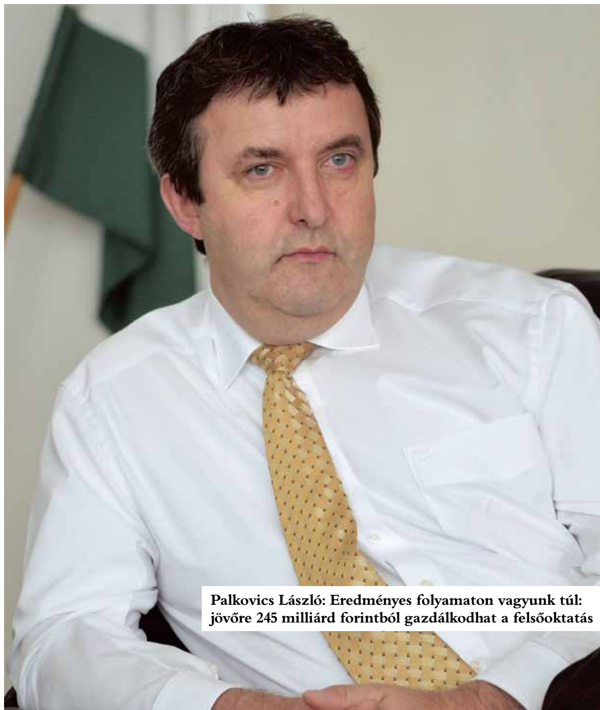
Palkovics László: Eredményes folyamaton vagyunk túl: jövőre 245 milliárd forintból gazdálkodhat a felsőoktatás